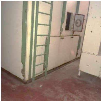
ESSICCATOIO LATO CARICO