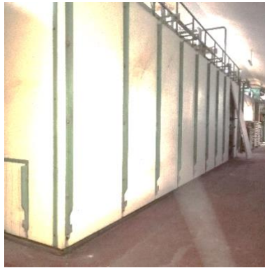
ESSICCATOIO VISTA LATERALE