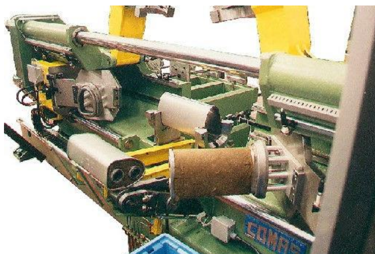
MC 0973 LEMOVÁNÍ BOXU A PLNĚNÍ PŘEPÁŽEK